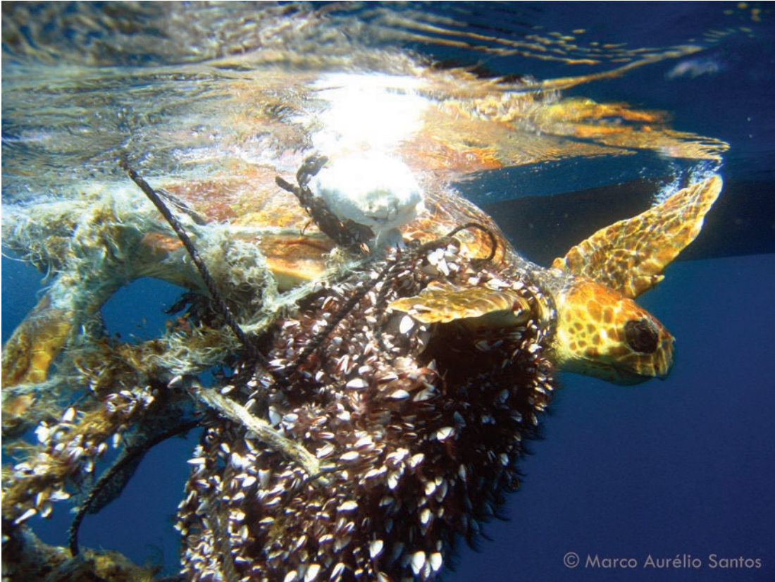
Tartaruga-boba ( Caretta caretta ) presa em restos de rede-de-pesca.

co (Barreiros, J. & O. Guerreiro, 2014). Também é conhecido um caso de um espadarte ( Xiphias gladius ) com um anel plástico preso na “espada” e de tintureiras ( Prionace glauca ) com pedaços de redes presas no corpo (M. Santos, com. pess.)