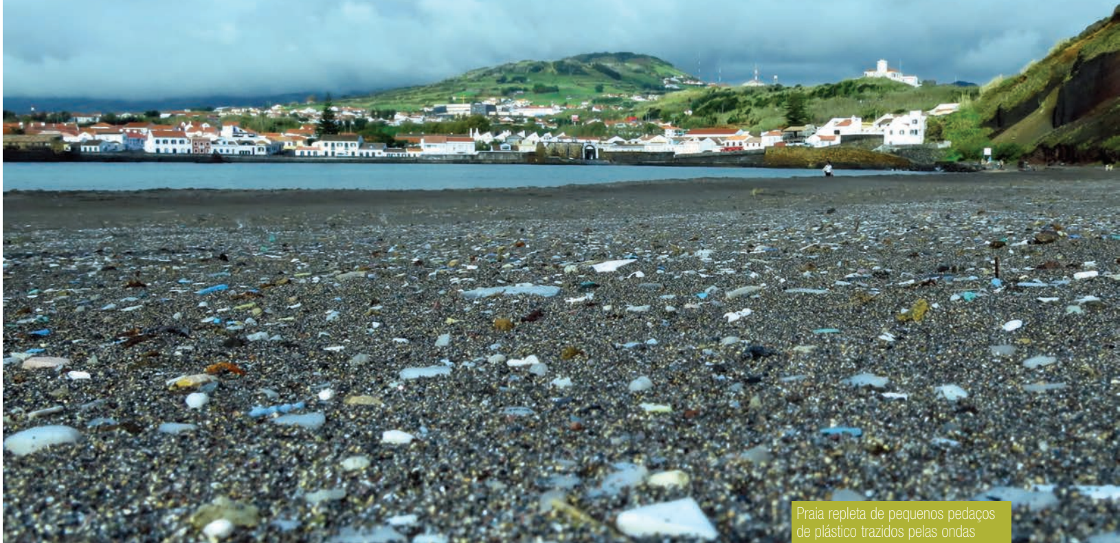
Praia repleta de pequenos pedaços de plástico trazidos pelas ondas