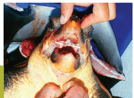
Tartaruga-boba ( Caretta caretta ) com haste de chupa-chupa presa na boca.

Acondicionar de forma adequada os resíduos plásticos para que não sejam levados pelo vento e pelas águas.