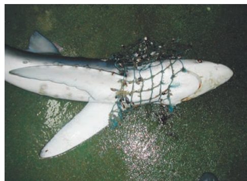
Tintureira ( Prionace glauca ) com resto de rede-de-pesca presa ao corpo.