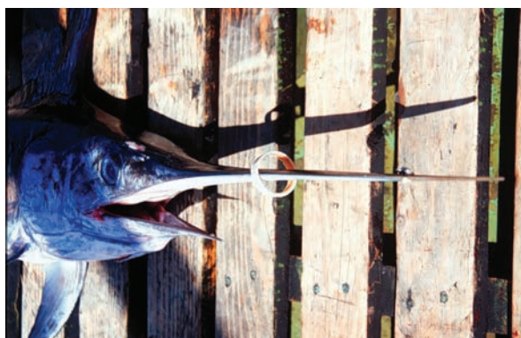
Espadarte ( Xiphias gladius ) com anel plástico na “espada”.

Em 2014 foi reportado, na ilha Terceira, um caso de um besugo ( Pagellus acarne ) estrangulado por um anel de plásti-