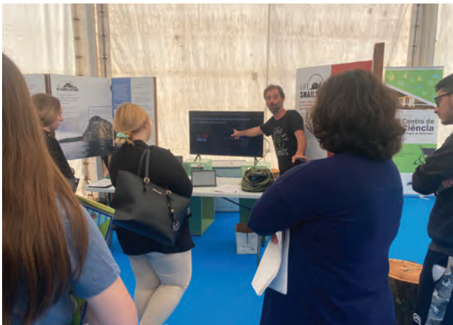
Ação de sensibilização LIFE Snails.

Portanto, toda a área de intervenção do projeto, pretende adequar o uso do solo às capaci-