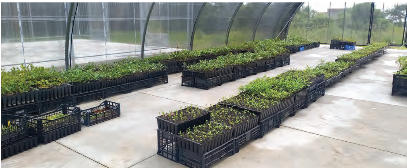
Viveiro de espécies endémicas para introdução em áreas abrangidas pelo LIFE Snails.