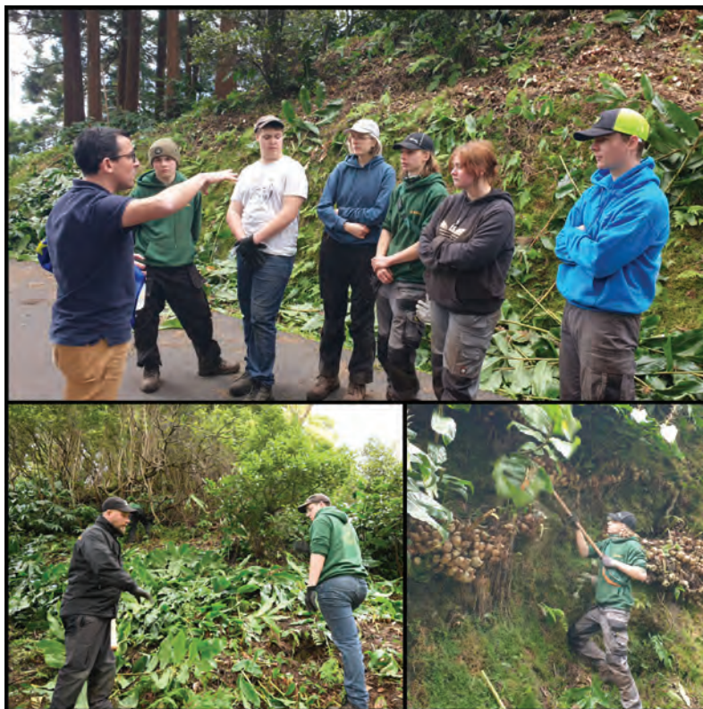
Intervenção de voluntários no combate a infestantes.

Participe e acompanhe os novos trabalhos nas redes sociais e em www.lifesnails.eu .