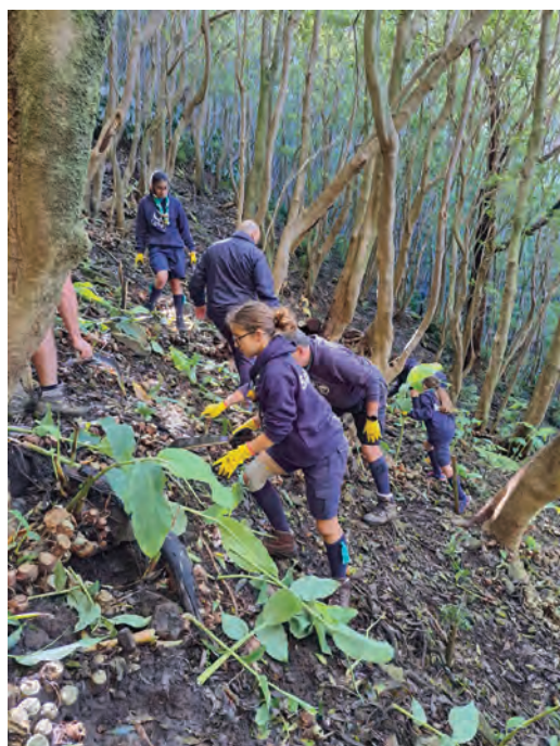
Voluntários no combate ao Hedychium gardnerianum .