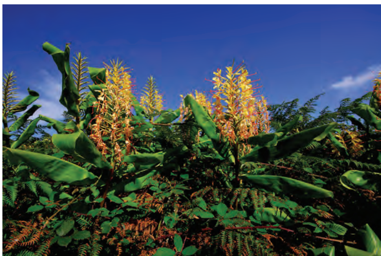
Hedychium gardnerianum . Espécie infestante alvo de intervenção, conhecida localmente como "jacintos".