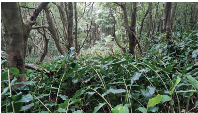
Comunidade de espécies invasoras, Hedychium gardnerianum e Pittosporum undulatum , conhecido localmente como "areias".