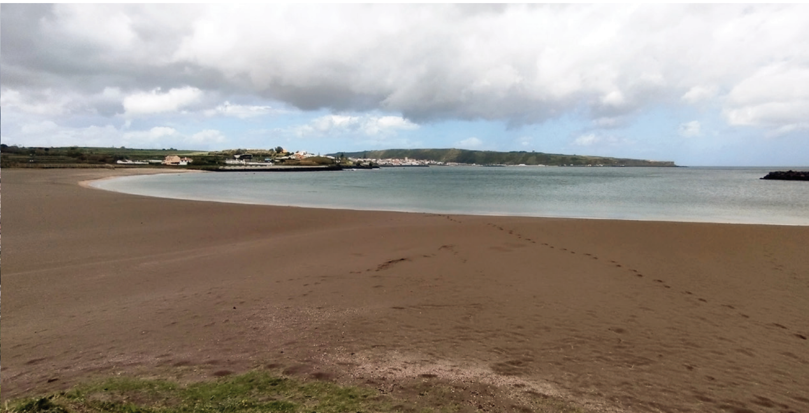
Fig.1. Praia da Riviera durante a Primavera, local onde se efectuaram grande parte das recolhas de amostras.

correntes marinhas que com o tempo vai acumulando e formando os areais. Para além do material geológico, também se acumula material orgânico que serve de alimento a microorganismos marinhos, fonte de alimento para muitas espécies pertencentes à meiofauna. Desta forma as praias não sofrem aumentos excessivos na composição da matéria orgânica, contribuindo a meiofauna para a limpeza das praias.