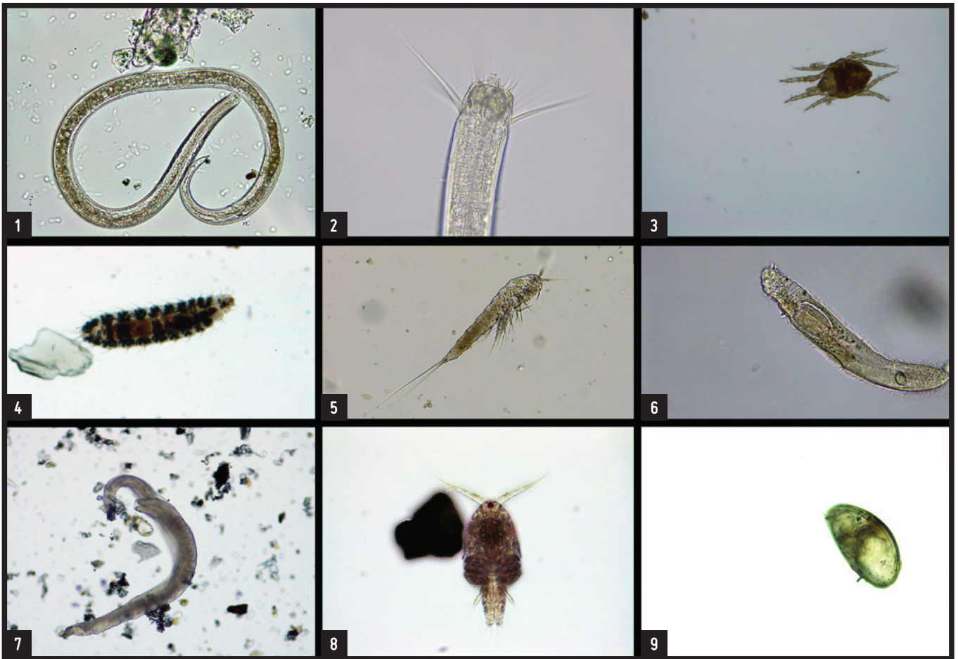
Fig.3 Meiofauna, espécies encontradas na Praia da Riviera. 1. Filo Nematoda , classe Enoplea; 2. pormenor das peças bucais de Filo Nematoda , classe Enoplea; 3. Filo Arthropoda , classe Arachnida, subclasse Acari; 4. Filo Annelida , classe Polychaeta; 5. Filo Arthropoda classe Copepoda ordem Canueloidea; 6. Filo Gastrotricha ; 7. Filo Platyhelminthes ; 8. Filo Arthropoda , classe Copepoda, ordem Cyclopoida; 9. Filo Arthropoda , classe Ostracoda.