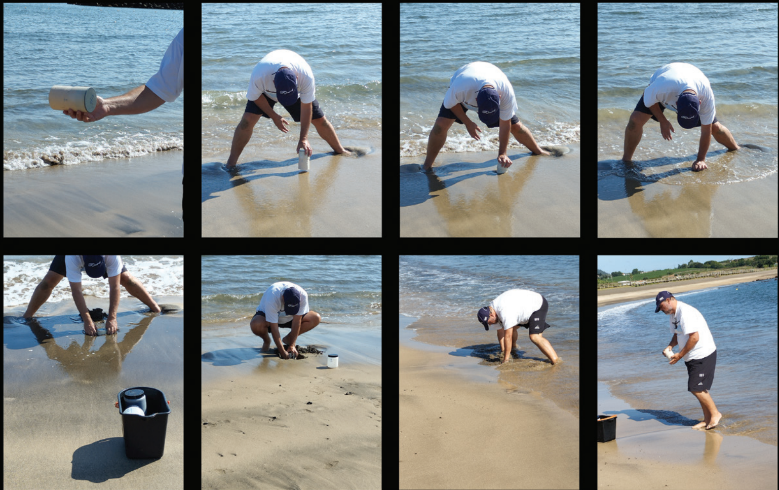
Fig.2. Demonstração da recolha de meiofauna na praia.

procurando identificar-se eventuais variações sazonais na zona de entre marés, em especial dentro dos grupos mais abundantes, como os nematodes, copépodes e ostracodes, mas também procurar entender-se a dinâmica das populações de foraminíferos, protistas com pseudópodes retracteis e com o protoplasma envolto por uma estrutura de rígida de origem mineral, que abundam nestas praias (fig.4).