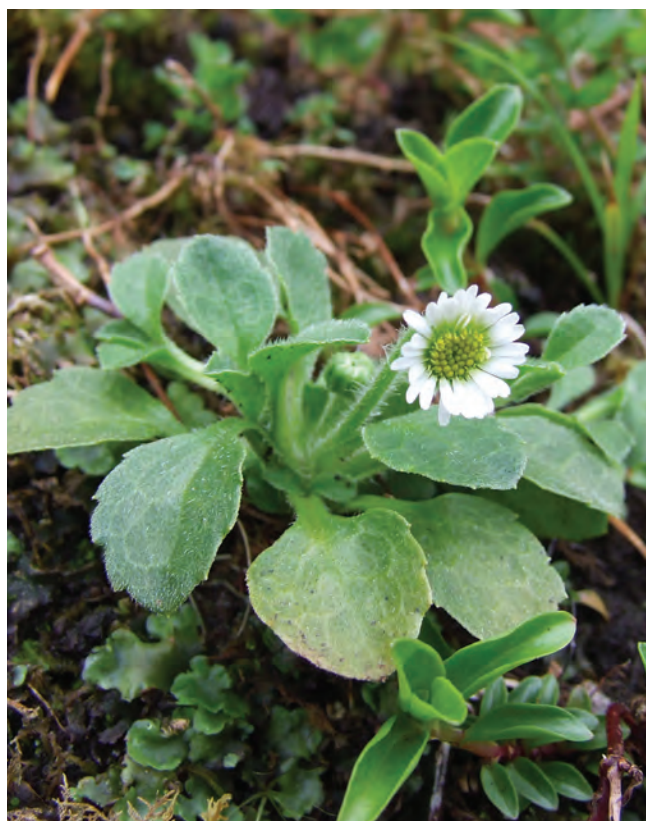
Bellis azorica : uma rara espécie endémica encontrada na margem de uma floresta pluvial montana do Pico.

Actualmente, a vegetação natural é encontrada principalmente acima dos 600 m de altitude, nas ilhas das Flores, Terceira e Pico. Esta vegetação natural sobrevivente é composta por florestas e bosques montanos dominados por Cedro e Azevinho ou apenas por Cedro. O Louro, a Urze e o San-