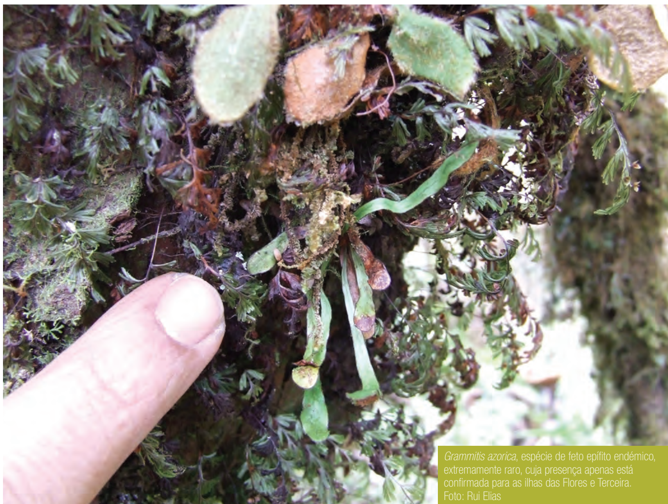
Grammitis azorica , espécie de feto epífita endémico, extremamente raro, cuja presença apenas está confirmada para as ilhas das Flores e Terceira.

JÁ A FLORESTA DAS NUVEIS MERECE MAIS RECONHECIMENTO POR AQUILO QUE É: UM CASO ÚNICO NO MUNDO E UM HOTSPOT DE BIODIVERSIDADE.