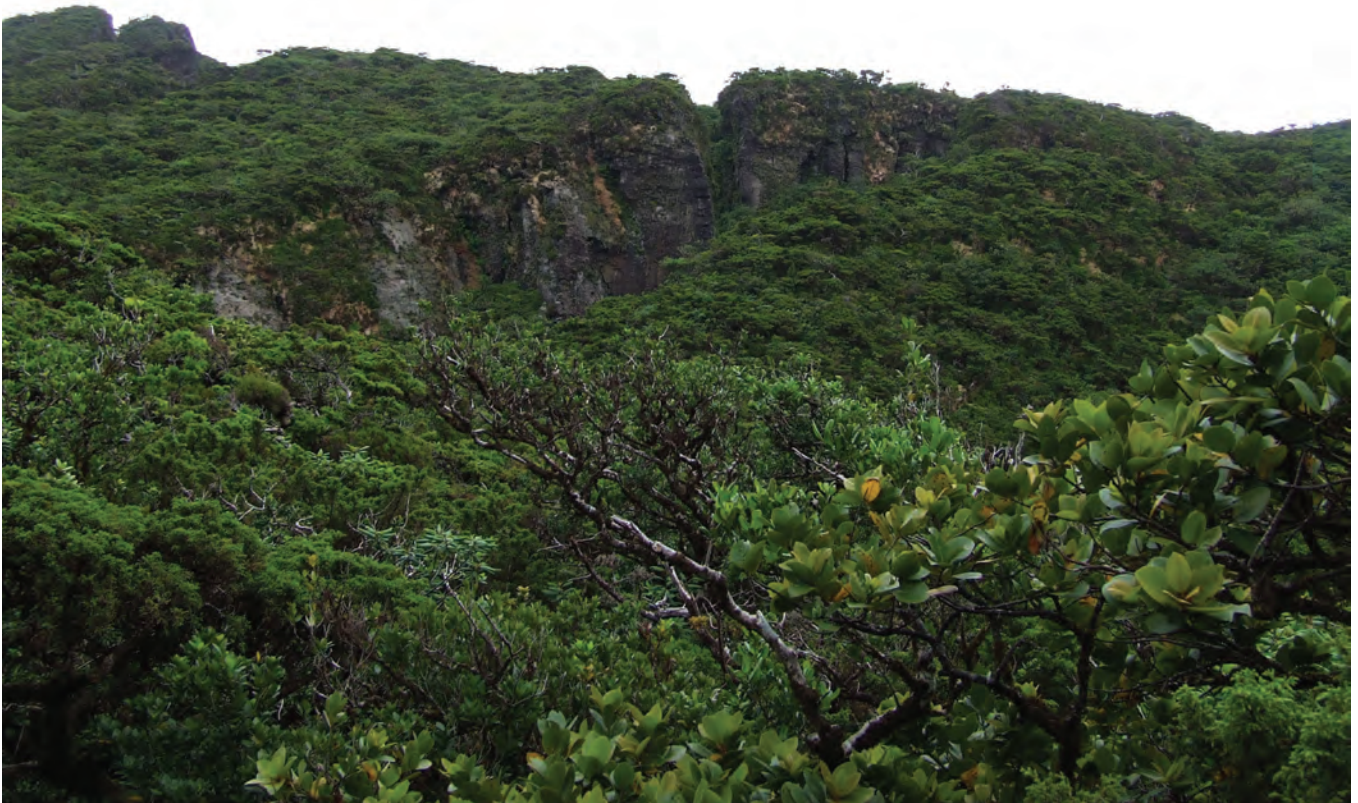
Floresta pluvial montana (ou floresta das nuvens) no Morro Assombrado (ilha Terceira).

percorrer por terra por ser muito escarpada e coberta de densas florestas e matos de Cedro, Faia, Louro, Ginja, Pau-Branco, Azevinho, Folhado, Urze, Tamujo e Queiró. O Pico era famoso pela abundância de madeira de Cedro, Sanguinho, Ginja, Pau-Branco, Faias, Louros, Folhado e Urzes «tão grandes como árvores». Na ilha das Flores referia-se a abundância de Cedros assim como a presença de Pau-Branco, Louro, Tamujo, Sanguinho e Queiró. Na Caldeira do Corvo existia mui-