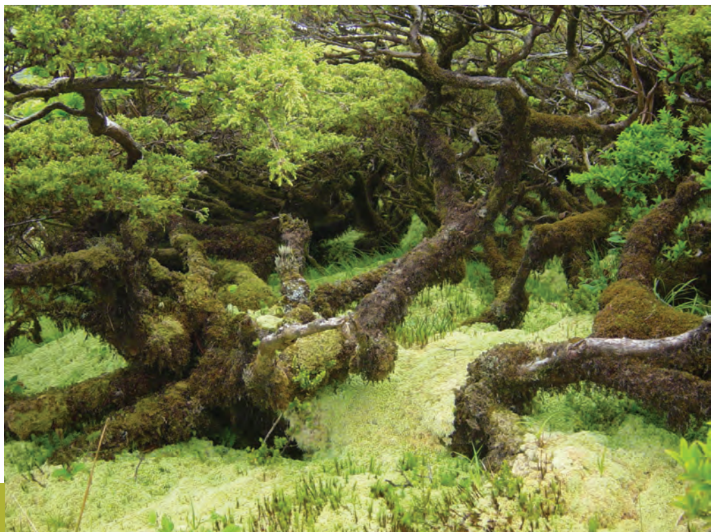
Bosque pluvial montano na ilha das Flores

Da análise dos relatos históricos torna-se claro que a vegetação dominante nos Açores era constituída por plantas lenhosas. Sem excepção, todas as ilhas estavam cobertas de densas florestas e matos. Podemos igualmente ter uma ideia da flora dominante nas formações vegetais: Cedro ( Juniperus brevifolia ), o Louro ( Laurus azorica ), a Faia ( Morella faya ),