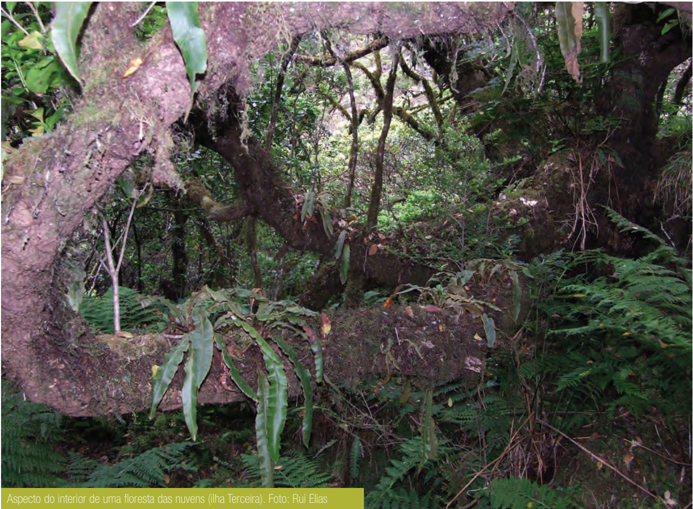
Aspecto do interior de uma floresta das nuvens (ilha Terceira).