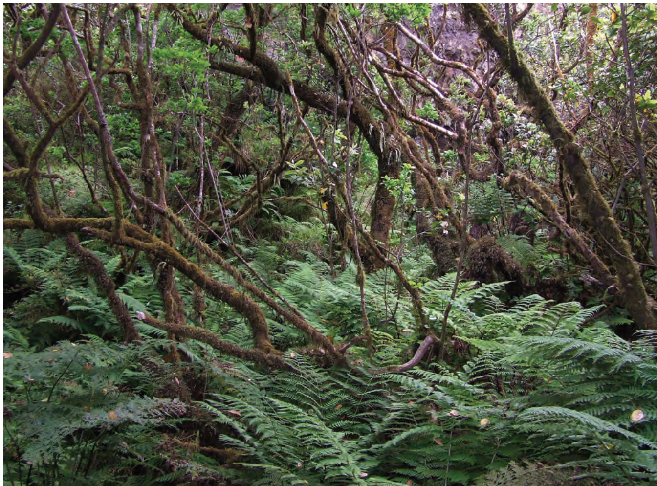
Floresta pluvial montana na ilha Terceira.

o Pau-Branco ( Picconia azorica ), a Ginja ( Prunus azorica ), o Sanguinho ( Frangula azorica ) e o Azevinho ( Ilex perado subsp. azorica ). Outras espécies lenhosas são abundantemente referidas como arbustos ou árvores: Urze ( Erica azorica ), Folhado ( Viburnum treleasei ), Tamujo ( Myrsine africana ) e Queiró ( Calluna vulgaris ).