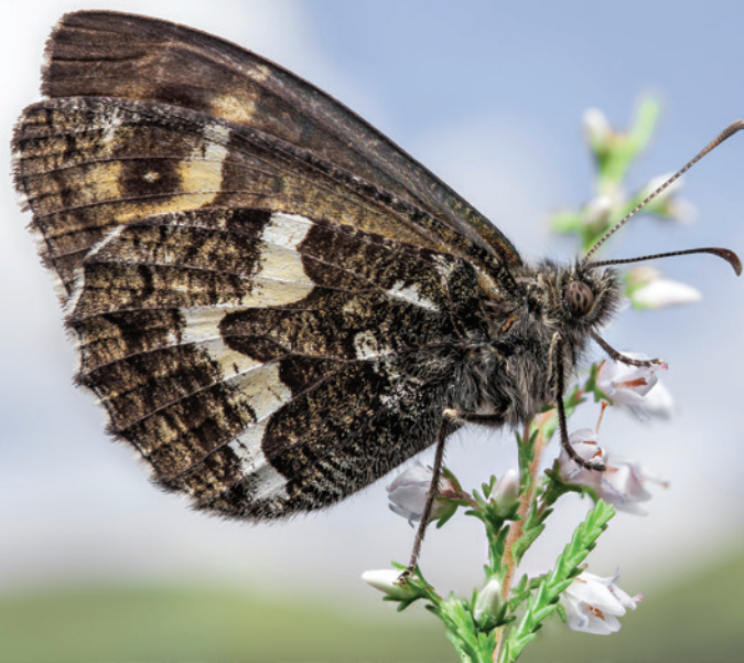
Borboleta castanha dos Açores ( Hipparchia azorina azorina )