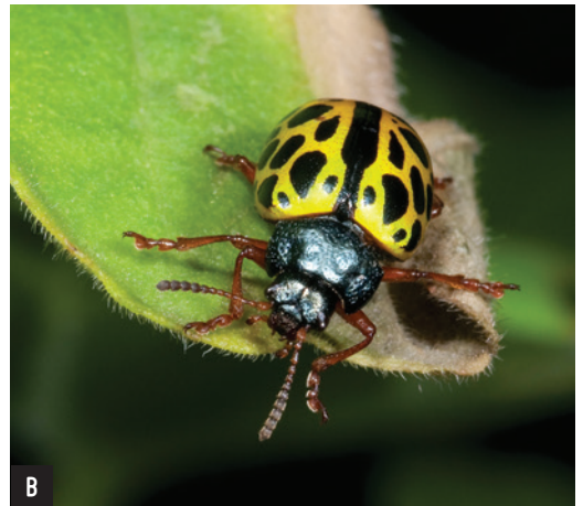
Figura 1: Alguns exemplos de espécies de coleópteros dos Açores: