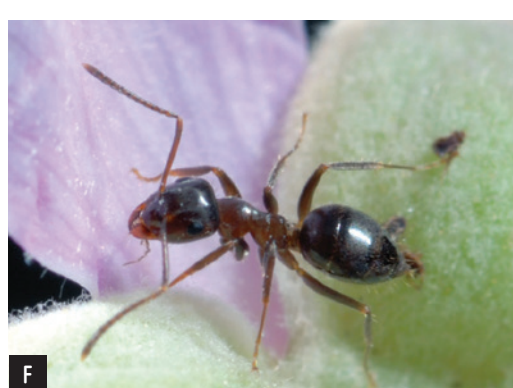
Figura 3: Alguns exemplos de espécies de himenópteros: A abelha cortadora de folhas ( Mega-chile centuncularis ); B abelha solitária ( Lasioglossum villosulum ); C zangão ( Bombus ruderatus ); D abelha doméstica ( Apis mellifera ); E vespa germânica ( Vespa germanica ) Fotos: Ana Picanço; F formiga comum ( Lasius grandis ) Foto: Paulo A. V. Borges.

Quanto à diversidade endêmica dos restantes insectos, as abelhas (Figura 3A, B, C, D), vespas (Figura 3E) e formigas (Figura 3F) (Hymenoptera) é menor, com poucas espécies consideradas eusociais, o que quer dizer verdadeiramente sociais com um grau complexo de organização e cooperação, à excepção das formigas (Figura 3F) e da Apis mellifera (Figura 3D). Em comparação, as borboletas e traças (Figura 4) (Lepidoptera) possuem um valor mais elevado de endemismo com 27% (Quadro 1), incluindo por exemplo a Hipparchia azorina azorina que se encontra na Lista Vermelha de espécies ameaçadas da União Internacional para a Conservação da Natureza e dos Recursos Naturais (IUCN) e a Pieris brassicae azorensis (Figura 4A e B). Contudo, há que realçar que as espécies Diptera e Hymenoptera necessitam de mais estudos/investigação, dado que existem poucos trabalhos realizados sobre estas Ordens em relação às restantes (Borges et al. 2010; Weissmann et al. 2017) e sobre a polinização por insectos